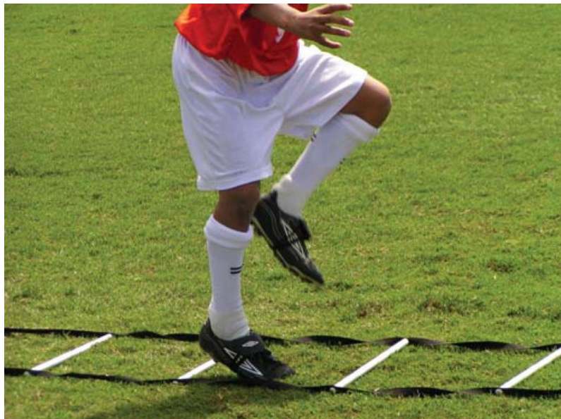
Sprint petit pas.

Ce n'est pas que la musculation est inefficace, mais attention de ne pas faire un travail qui nuit aux qualités recherchées pour le cricket (par exemple un gonflement trop prononcé des biceps peut être contre-productif pour les lanceurs).