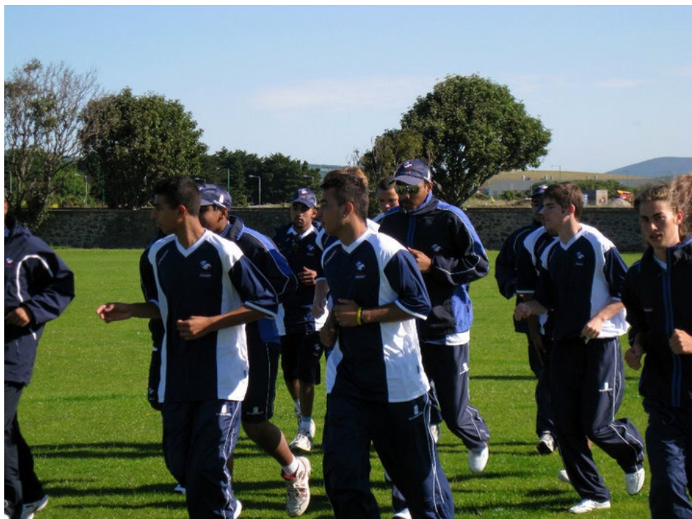
Les Bleuets lors de l'échauffement. Il faut s'échauffer avant tout effort physique.

Ainsi, on ne donnera pas le même programme à un adulte et un jeune, un homme et une femme, un débutant et un joueur aspirant à performer à haut niveau. Parmi les autres facteurs qui devront être pris en compte, on retrouve par exemple le temps disponible (travail, contraintes scolaires ?), la place occupée par le sport dans la vie du joueur (simple hobby, ou pratique plus sérieuse ?), etc.